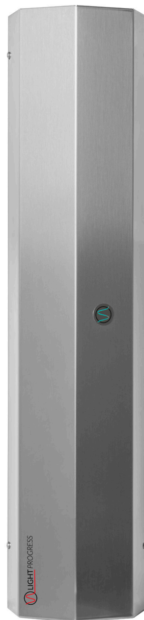
TABLE - Tabella